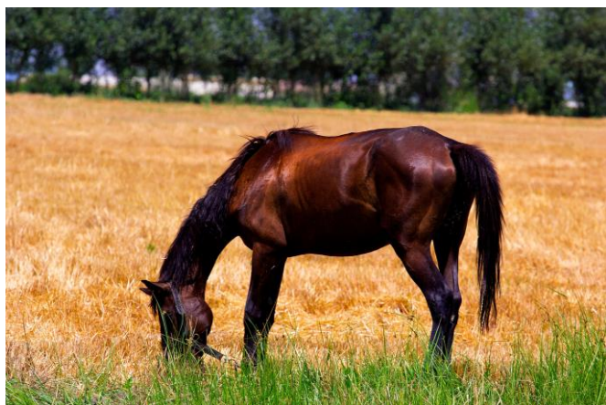
Gemeinde: dynamisch, elegant im Erntefeld